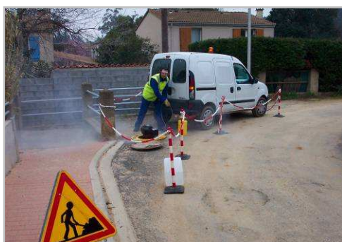
Point d'injection du fumigène dans le réseau d'assainissement