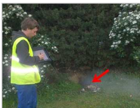
Saisie informatique des anomalies observées sur le terrain